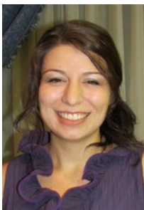
Ds Rue Hopley