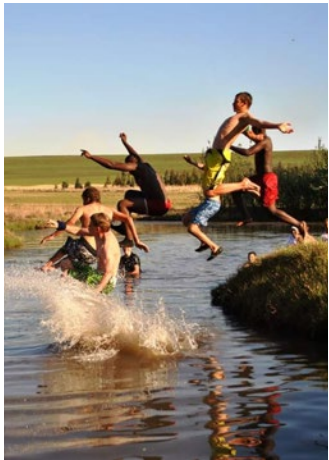
Die ontwikkeling van die Kinderhuise | 4-5