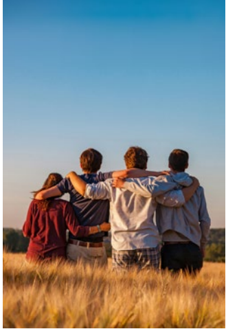
Kontak is jou keuse | 3