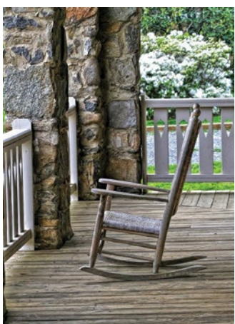
Stoepstories | 8