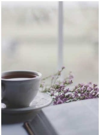
'n Ruimtelike perspektief op Boek IV van die Psalms | 6