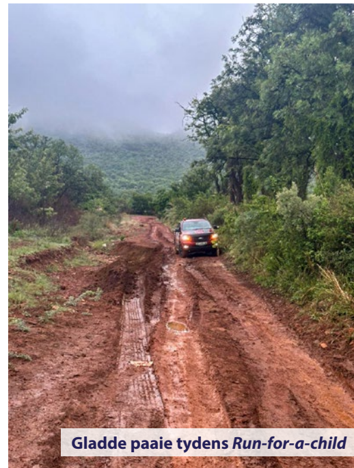
Gladdie paaie tydens Run-for-a-child